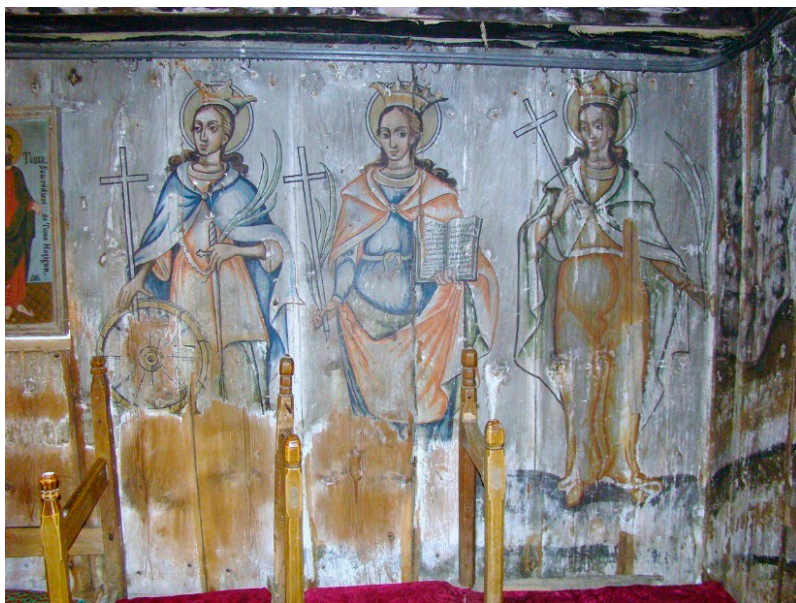
Pictură din tindă, biserica din Dubești