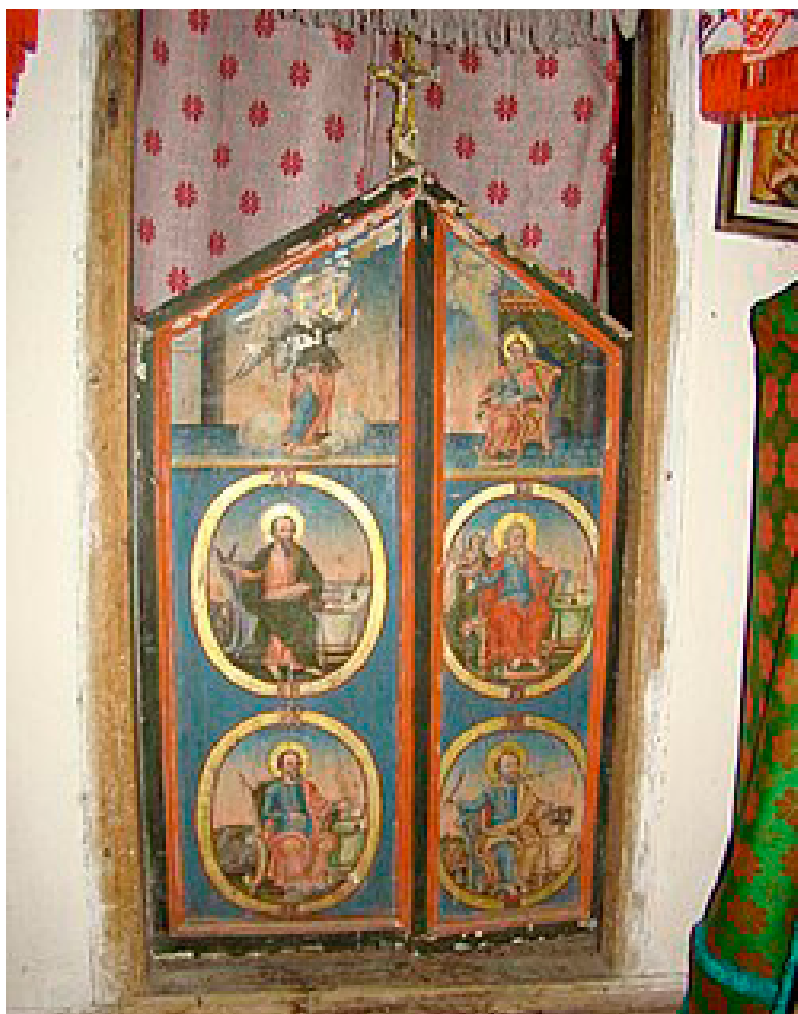
Ușile împărătești, Crivina de Sus

cazul acestor icoane, tehnica utilizată este folosirea unui suport de lemn, cioplit, fasonat, cu prindere cu o traversă pe verso, grunduit, pictat cu pensula, rama prinsă de panou cu cuie de lemn. La fel ca și în alte părți, partea superioară a iconostasului bisericii de lemn din Crivina de Sus era finalizat prin reprezentarea temeii Răstignirii. Această temă, în acest caz a fost tratată prin intermediul unui ansamblu format din trei piese, un crucifix central, respectiv figurile Maicii Domnului în partea stângă și cea a Sfântului Ioan în partea dreaptă. Pe crucifix, singurul element din ansamblu ce încă se mai găsește în biserica din Crivina de Sus se află înscris anul 1805.