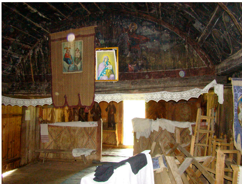
Naosul bisericii din Dragomirești

Biserica din Dragomirești a fost construită la 1754 în Zorlențul Mare, din actualul județ Caraș-Severin, de unde, la începutul secolului al XIX-lea, a fost vândută satului Dragomirești, unde se păstrează până în prezent, așezată pe o colină. 17 După tradiție, biserica ar fi fost cumpărată pe la anul 1750.